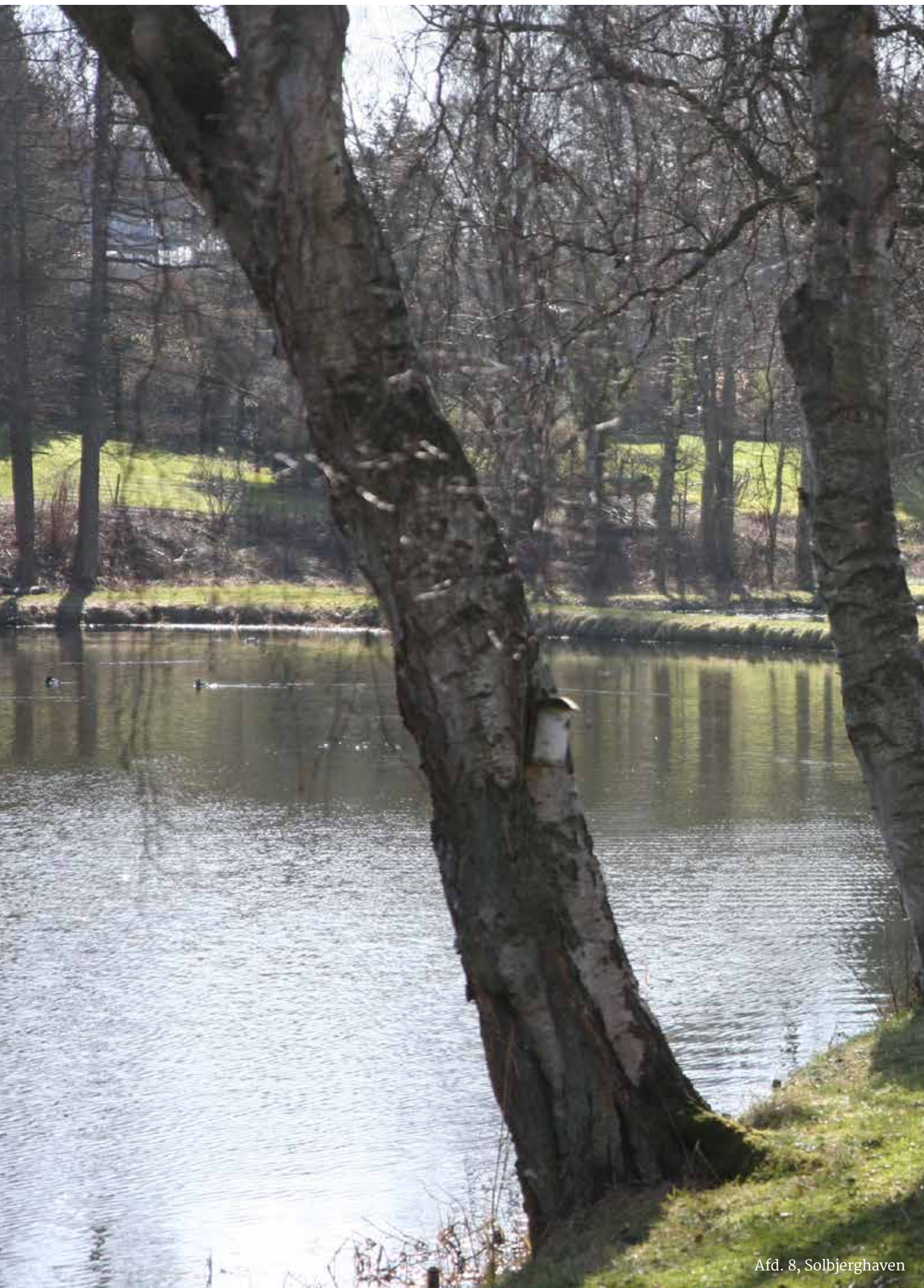
Afd. 8, Solbjerghaven