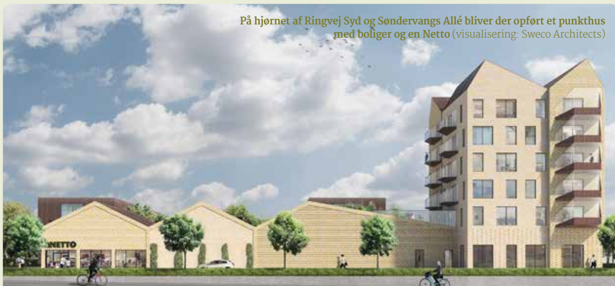
På hjørnet af Ringvej Syd og Søndervangs Allé bliver der opført et punkthus med boliger og en Netto (visualisering: Sweco Architects)