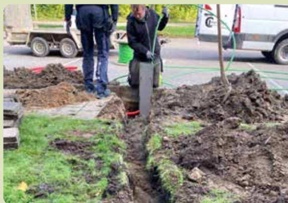
Arbejdet er godt i gang ↑