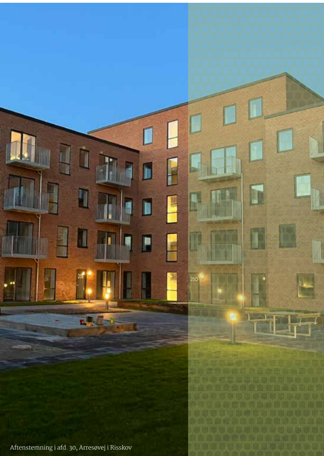
Aftenstemning i afd. 30, Arresøvej i Risskov

I en almen boligforening er beboerne fælles om udgifterne