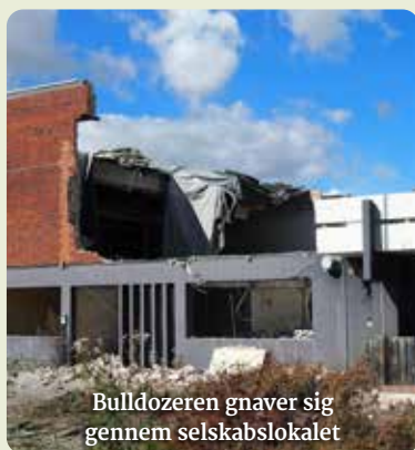
Bulldozeren gnaver sig gennem selskabslokalet