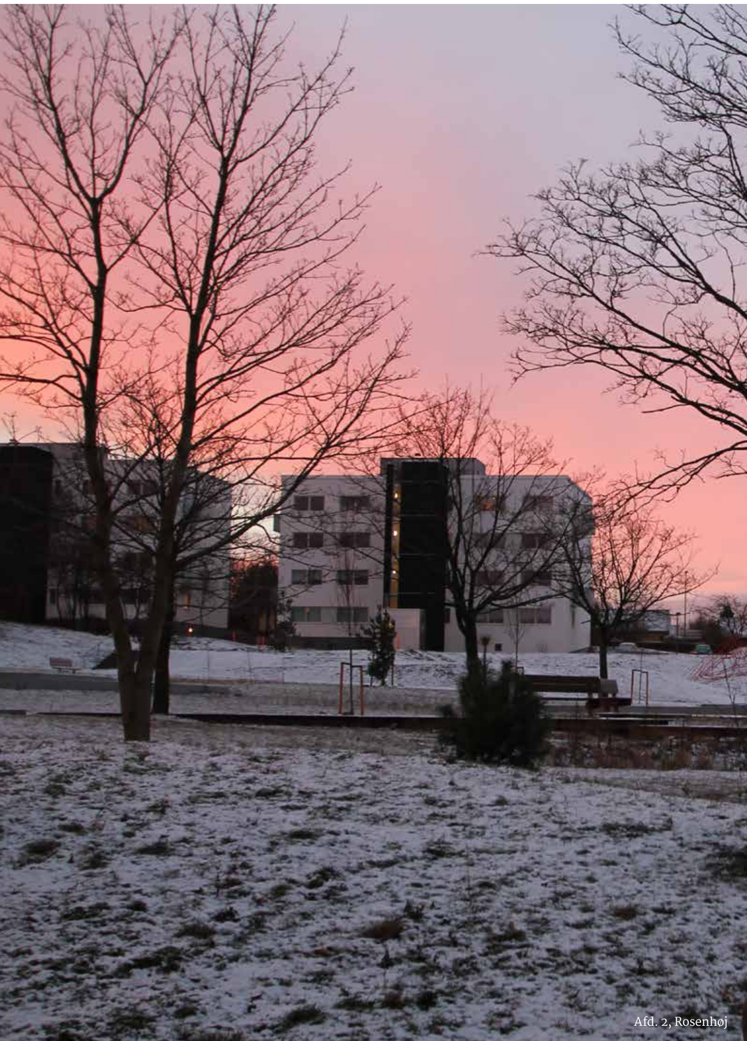
Afd. 2, Rosenhøj