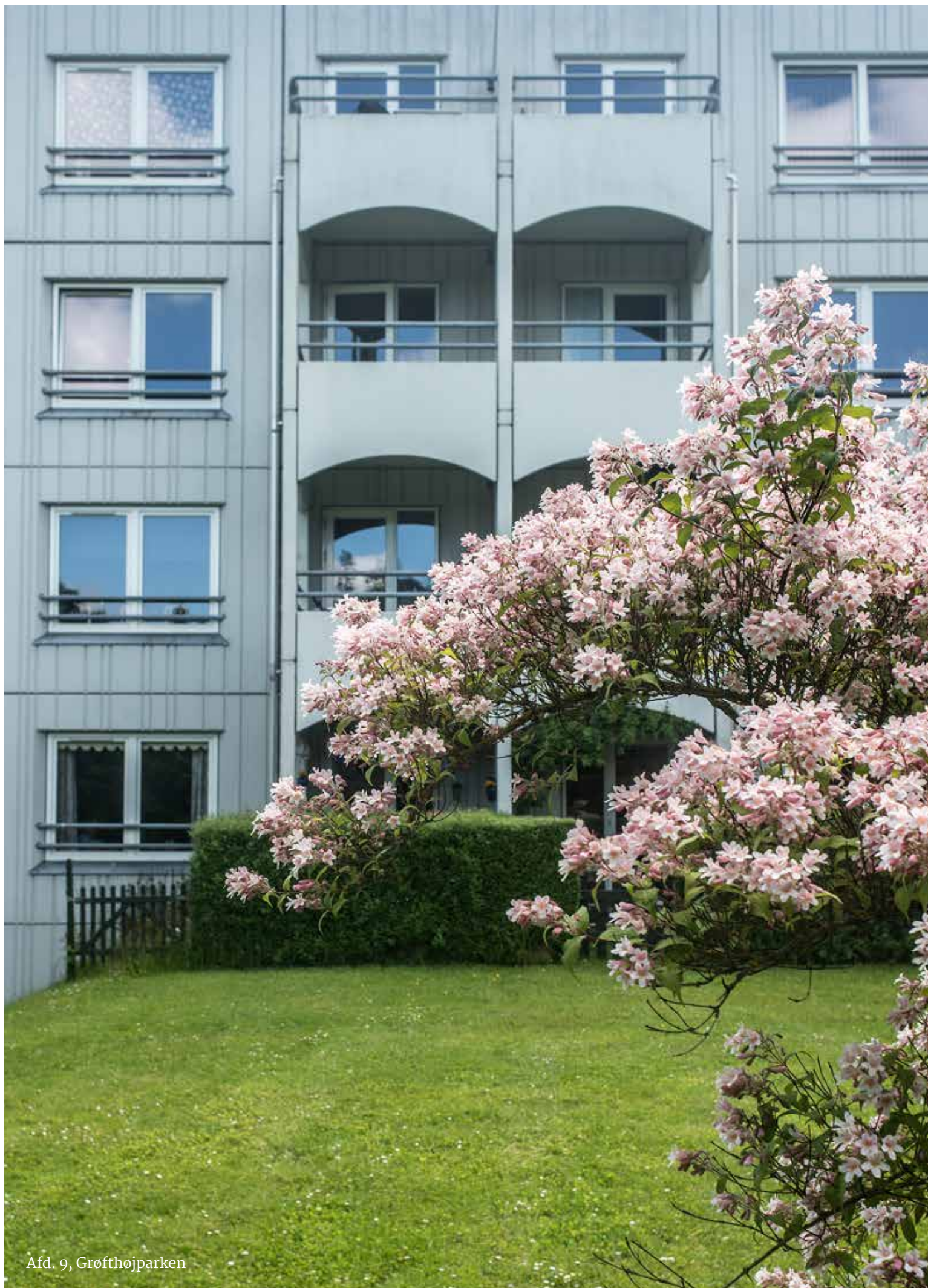
Afd. 9, Grøfthøjparken