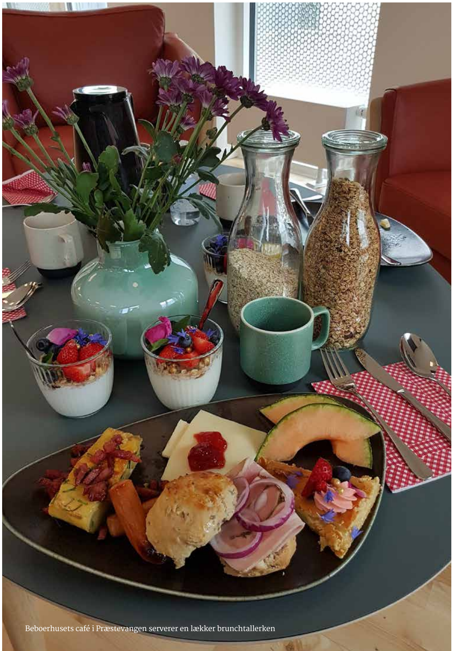
Beboerhusets café i Præstevangen serverer en lækker brunchtallerken