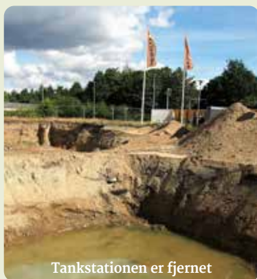
Tankstationen er fjernet

Det forventes, at byggeriet af Netto og punkthus vil stå færdigt medio 2024. ■